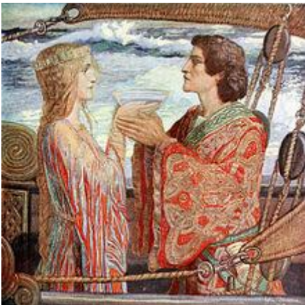
Tristan & Isolde by John Duncan (1866-1945)

Dans ce séminaire, nous examinerons la relation entre l'amour et le sacrifice présente dans tous les domaines de la vie, qu'il s'agisse des relations romantiques, de la vie de famille, du monde professionnel ou de l'engagement civique. D'une part, qui n'a pas rêvé d'un grand amour qui pourrait engendrer des sentiments réciproques, des plaisirs et joies partagés, qui, à leur tour, amèneraient à l'acceptation inconditionnelle de et par l'Autre ? De l'autre, qui ne craint pas les sacrifices continus, les dettes financières, les obligations familiales ou les responsabilités professionnelles, qui entraîneraient l'abnégation de soi ? Comment s'engager envers les autres sans mettre en péril sa propre liberté tout en cherchant à préserver la sécurité d'un contrat social qui veillerait au respect de la dignité de chacun et de l'équité pour tous ?